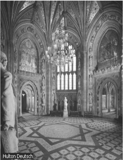
----- ဗြိတိသျှ အထက်လွှတ်တော် House of Lords

ပါလီမန်အစိုးရစနစ်ကို ကမ္ဘာ့နိုင်ငံအတော်များများတွင် ကျင့်သုံးနေသည်ကို တွေ့ရသည်။ ပါလီမန်ဒီမိုကရေစီဟု ပြောလိုက်လျှင် ဗြိတိသျှပုံသဏ္ဍာန် အစိုးရမျိုးကို သတ်ပြုကြပေလိမ့်မည်။ အဘယ်ကြောင့်ဆိုသော် ယနေ့ ကမ္ဘာ့နိုင်ငံများ၏ ပါလီမန်ဒီမိုကရေစီ ခေါ် ပါလီမန်အစိုးရစနစ်များသည် ဗြိတိသျှပုံသဏ္ဍာန်ကိုအခြေတည်ထားပြီး မိမိတို့နိုင်ငံနှင့် သင့်လျော်သောအနေအထားအရအောင် အချို့သောပြင်ဆင်မှုများဖြင့် ကျင့်သုံးနေကြခြင်း ကြောင့်ဖြစ်သည်။ သို့ဖြစ်၍ ပါလီမန်ဒီမိုကရေစီအကြောင်းလေ့လာရာတွင် ဗြိတိသျှပုံသဏ္ဍာန်အစိုးရမှ သိမှတ်ဖွယ်ရာအချက်အချို့ကို ပေါင်းစပ်ပြီး လေ့လာရန်လိုသည်။ အချို့က ဗြိတိသျှပုံသဏ္ဍာန် ပါလီမန်ဒီမိုကရေစီကိုတမျိုး၊ အခြားနိုင်ငံများမှ ပါလီမန်ဒီမိုကရေစီကိုတမျိုး ခွဲခြားလေ့လာကြသည်။ ပါလီမန်ဒီမိုကရေစီနှင့် သီးသန့်သက်ဆိုင်သော ဝေါဟာရ အချို့အကြောင်း တင်ပြရန်လိုအပ်လာပါသည်။