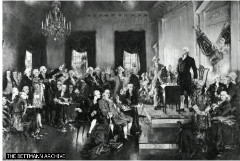
အမေရိကန် ပြည်ထောင်စု အခြေခံဥပဒေ ဆွေးနွေးခဲ့သော ၁၇၈၇ ခုနှစ် ဖီလယ်ဒီးဖီးယား အခြေခံဥပဒေညီလာခံ ကျင်းပပုံမြင်ကွင်း

ခြေပြည်သူလူထုက ရွေးချယ်ပြီး လွှတ်လိုက်တာလေ၊ အဲ့ဒီမှာ ထူးခြားတာက ကိုယ်စားလှယ်တွေဟာ ညီလာခံကို မသွားခင်မြို့ပြဒေသတွေတင်မကပဲ ကျေးလက်က ဝါစိုက်ခင်းတွေ ဆေးရွက်ကြီးစိုက်ခင်းတွေကလယ်သမားတွေအထိတအိမ်တက်ဆင်းသွားပြီးဆန္ဒသဘောထားတွေ မေးမြန်းကောက်ယူကြတယ်လေ။