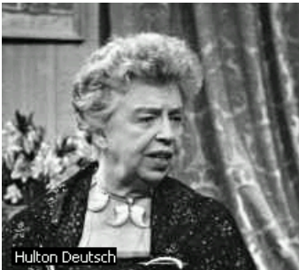
အမေရိကန်သမ္မတ တဦး၏ဇနီးဖြစ်သူ အလီယန်နော-ရို.ဇဗက်

ညီတညွတ်တည်း အတည်ပြုခဲ့ပါတယ်။ အပြည်ပြည်ဆိုင်ရာလူ့အခွင့်အရေးကြေညာစာတမ်းမှာ ပြည့်စုံမှုမရှိသေးတဲ့ လူ့အခွင့်အရေးစံတွေကို ထပ်မံဖြည့်စွက်တဲ့အနေနဲ့ ၁၉၆၆ ခုနှစ်မှာ အပြည်ပြည်ဆိုင်ရာ နိုင်ငံသားနဲ့နိုင်ငံရေးအခွင့်အရေးဆိုင်ရာ သဘောတူစာချုပ် (International Covenant on Civil and Political Rights) နဲ့ အပြည်ပြည်ဆိုင်ရာ စီးပွားရေး၊ လူမှုရေးနဲ့ယဉ်ကျေးမှုဆိုင်ရာ သဘောတူစာချုပ် (International Covenant on Economic, Social and Cultural Rights) တွေကို ပြဌာန်းပြီး အဲဒီစာချုပ်နှစ်ခုစလုံး ၁၉၇၇ ခုနှစ်မှာ အာဏာတည်လာပါတယ်။ ဒီကနေ့ အပြည်ပြည်ဆိုင်ရာ လူ့အခွင့်အရေးဥပဒေလိုပဲပြောရင် အဲဒီစာချုပ်နှစ်ခုနဲ့ အပြည်ပြည်ဆိုင်ရာ လူ့အခွင့်အရေးကြေညာစာတမ်းတွေက အဓိက ပါဝင်ပါတယ်။